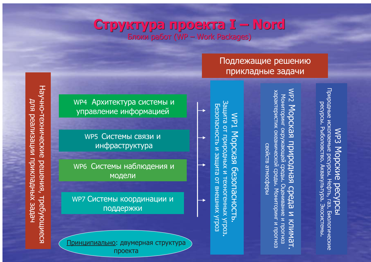
Рис. 1. Концепция и структура проекта по созданию целостной системы мониторинга арктических морей

оценки разведанных и неразведанных запасов нефти и газа в Арктике.