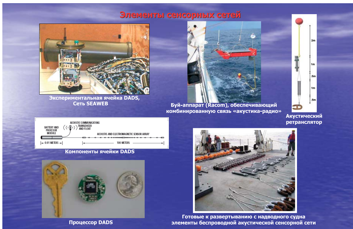
Рис. 6. Элементы экспериментальной системы наблюдения, основанной на использовании сенсорных сетей с сетевой акустической и комбинированной связью

что касается их улучшения, достигнут значительный прогресс. Совершенствование характеристик и устойчивости сетей подводной акустической связи в последнее десятилетие оказалось обещающим настолько, что они стали рассматриваться в качестве основного варианта создания долговременных систем мониторинга в отношении различных прикладных задач [10]. В табл. 1 представлены данные по соответствию расстояний между ячейками сети и используемыми рабочими частотами. В качестве примера на рис. 6 представлены элементы системы наблюдения DADS, основанной на использовании акустической и комбинированной (акустика и радио) сенсорной сети.