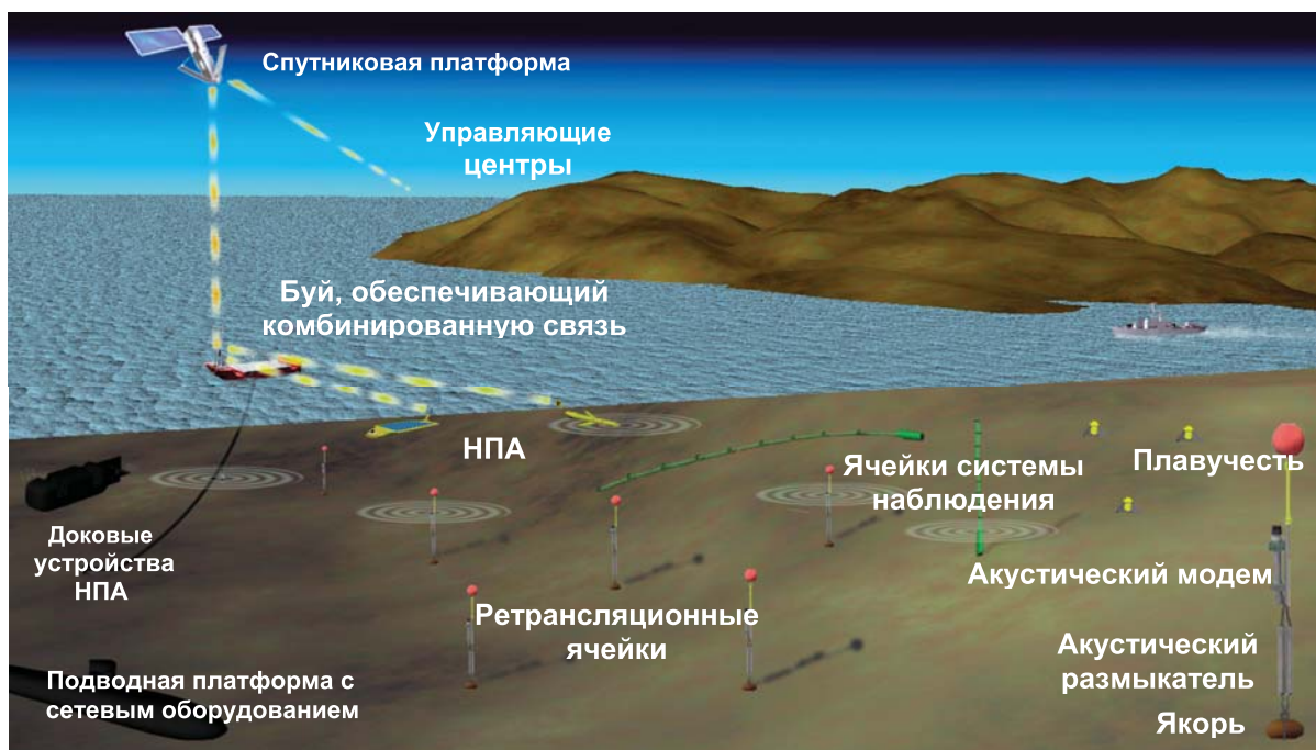
Рис. 5. Вариант организации системы наблюдения, основанной на использовании сенсорных сетей

Трудности с применением систем этого типа возникают также при необходимости оперативной установки систем в новых географических районах. В ряде важных случаев, например, когда системы формируются из (или с привлечением) мобильных элементов — автономных аппаратов, использование кабельных систем просто невозможно. Именно поэтому характерной современной тенденцией при создании морских информационных систем является ориентация на применение беспроводных сенсорных сетей. Причем эта тенденция распространяется на все отмеченные на рис. 1 прикладные задачи. В работах (например, в [9]), касающихся обеспечения безопасности морских объектов имеется дополнительная аргументация в пользу беспроводных сенсорных сетей. Она сводится к тому, что важным свойством средств