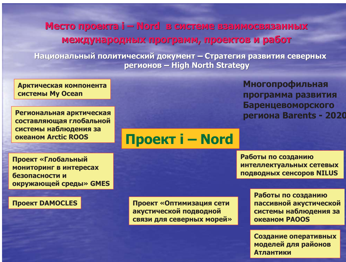
Рис. 2. Место проекта i-Nord в системе взаимосвязанных международных программ, проектов и работ

Все работы скомпонованы в организованные в виде двумерной структуры взаимосвязанные блоки работ (WP — Work Packages). Эта структура, одновременно являющаяся концепцией проекта, показана на рис. 1. Вертикально ориентированными блоками (WP1—WP3) представлены приложения с их требованиями, горизонтальными блоками (WP4—WP7) — пакеты работ, которые путем реализации соответствующих научно-технических решений должны ответить на исходящие от приложений требования.