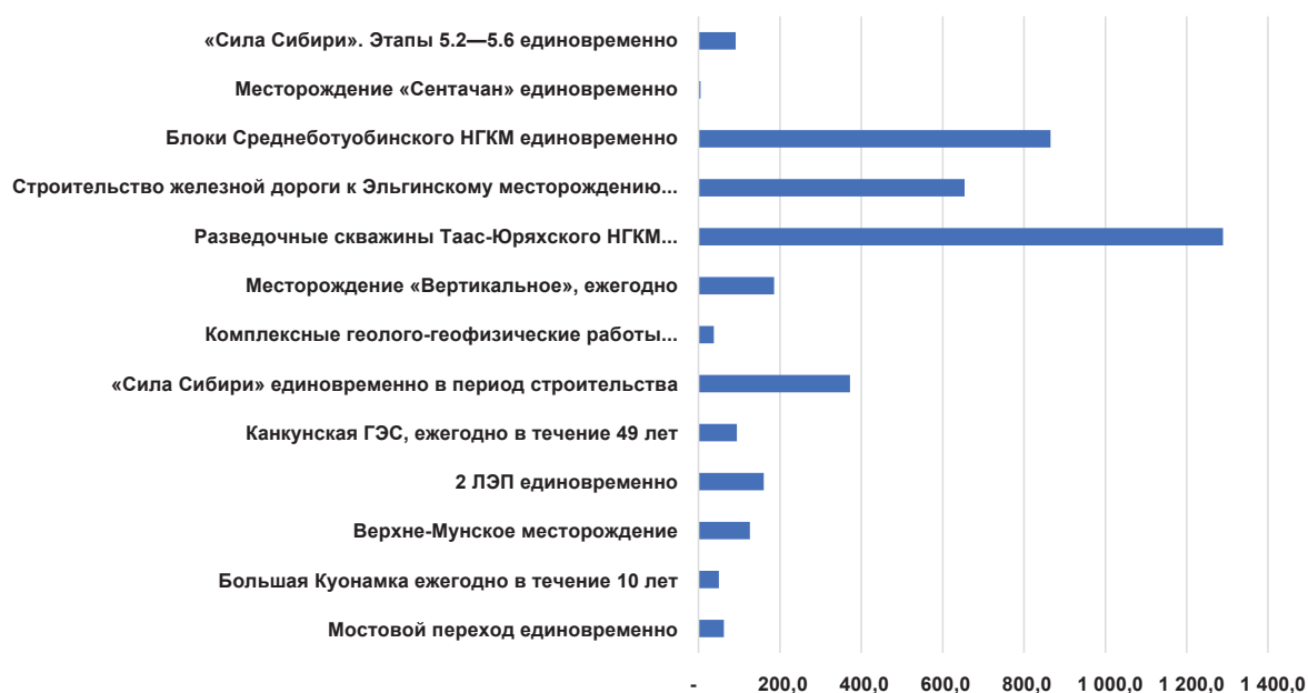
Рис. 2. Размер компенсации ущерба, наносимого традиционной хозяйственной деятельностью, в расчете на одного члена общины, тыс. руб./чел.