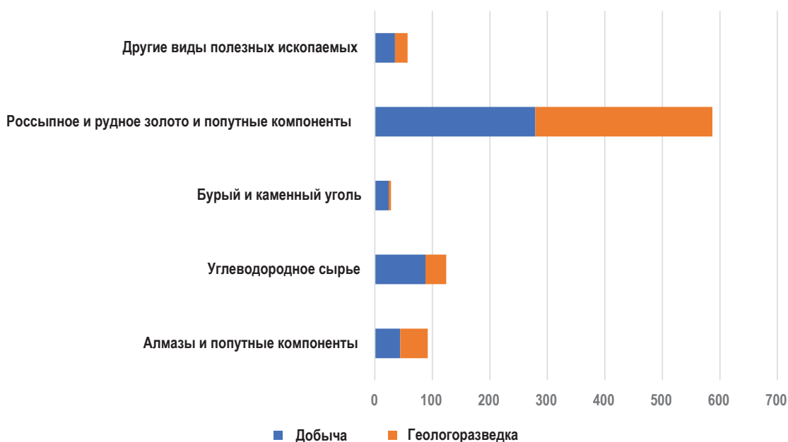
Рис. 3. Распределение действующих лицензий на территории РС(Я) по видам полезных ископаемых Fig. 3. Distribution of valid licenses on the territory of the Republic of Sakha (Yakutia) by mineral types

В 2018 г. помощь общинам коренных народов составила 123,5 млн руб.