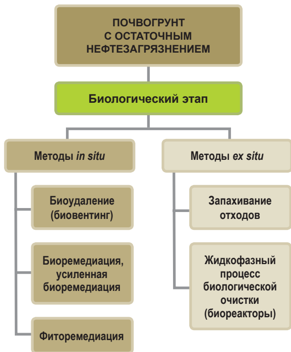
Рис. 3. Мероприятия биологического этапа рекультивации и ремедиации [8; 10–12] Fig. 3. Activities of the remediation biological stage [8; 10–12]

растений для фиторемедиации территории должен основываться на изучении перспективности тех видов растений, что присущи данному биогеоценозу. Это позволит избежать изменения видового состава и биоразнообразия арктических экосистем вследствие интродукции инвазивных видов.