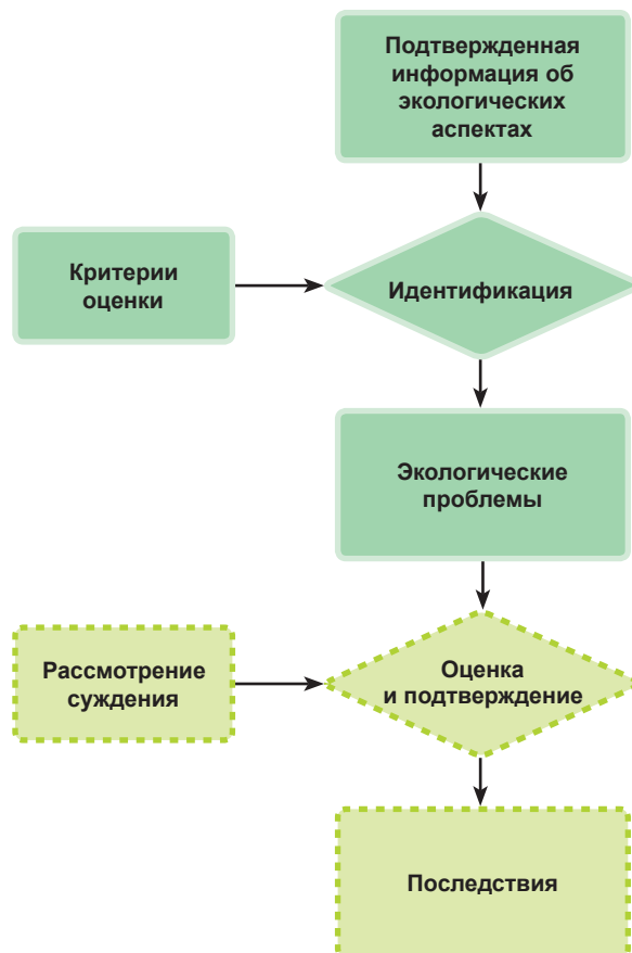
Рис. 1. Алгоритм идентификации экологических аспектов и последствий (оценка последствий опциональна) 2 Fig. 1. Algorithm for identifying environmental aspects and consequences (impact assessment is optional) 2

В соответствии с алгоритмом процесса экологической оценки участков и организаций согласно