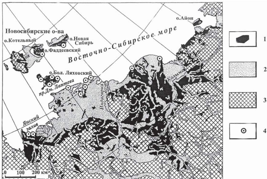
Рис. 1. Схема распространения продуктивных (костеносных) отложений на севере Якутии (Яно-Колымское междуречье): 1 – позднеледниковые лессово-ледовые образования («едомая свита») – первичные костеносные коллекторы; 2 – комплекс голоценовых – современных полигенных образований: озерно-болотные («аласных котловин»), прибрежно-морские, аллювиальные и др. – костеносные коллекторы второй и последующих генераций; 3 – горные сооружения; 4 – месторождения мамонтовой кости с учтенными запасами и ресурсами, выявленные на этапе поисково-оценочных работ в 1980-х годах СПО «Северкварцсамоцветы»

Такое положение дел не отвечает фактическому состоянию действий субъектов, осуществляющих использование ИМК, привычкам и отношению к ИМК представителей коренных малочисленных народов Севера, не согласуется с разрешительными документами органа управления государственным фондом недр.