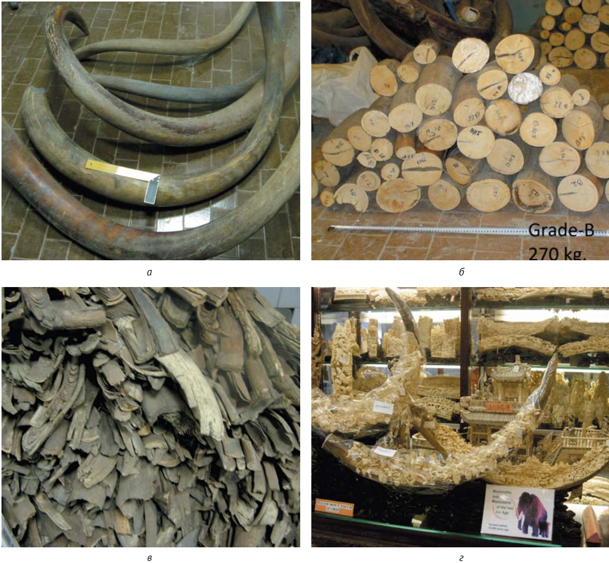
Рис. 4. Ископаемая мамонтовая кость: а – бивни коллекционные, б – бивни поделочные сортовые, в – низкосортное сырье (щепы), г – изделия китайских мастеров из мамонтовых бивней

бивней, проводившиеся в Якутске Министерством по делам предпринимательства, развития туризма и занятости Республики Саха (Якутия) с 2005 по 2009 гг. (всего проведено шесть аукционов). Главной их целью являлась легализация оборота мамонтовой кости и других остатков мамонтовой фауны. Одним из основных требований для держателей лицензии на добычу ИМК было обязательное представление недропользователями трети добытой мамонтовой кости на аукцион, но это требование практически не исполнялось.