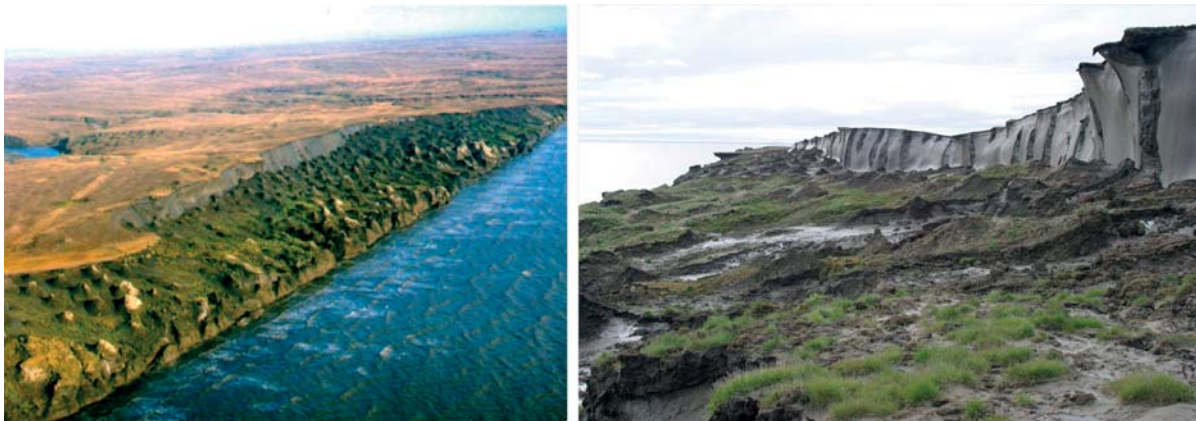
Рис. 2. Термоэрозивная терраса в костеносных криогенно-эоловых образованиях позднего плейстоцена. Южный берег острова Большой Ляховский, Новосибирские острова

Указанные работы проводились в рамках «Программы геологоразведочных и добычных работ на мамонтовую кость на Севере Якутской АССР в XII пятилетке (1986—1990 гг.)» согласно распоряжениям Совета Министров Якутской АССР, а оцененные запасы и прогнозные ресурсы ИМК были приняты на баланс Центральной комиссии запасов полезных ископаемых (ЦКЗ) (секция пьезооптического и камнесамоцветного сырья) Министерства геологии СССР. Таким образом, к началу 1990-х годов ИМК была признана одним из видов полезных ископаемых.