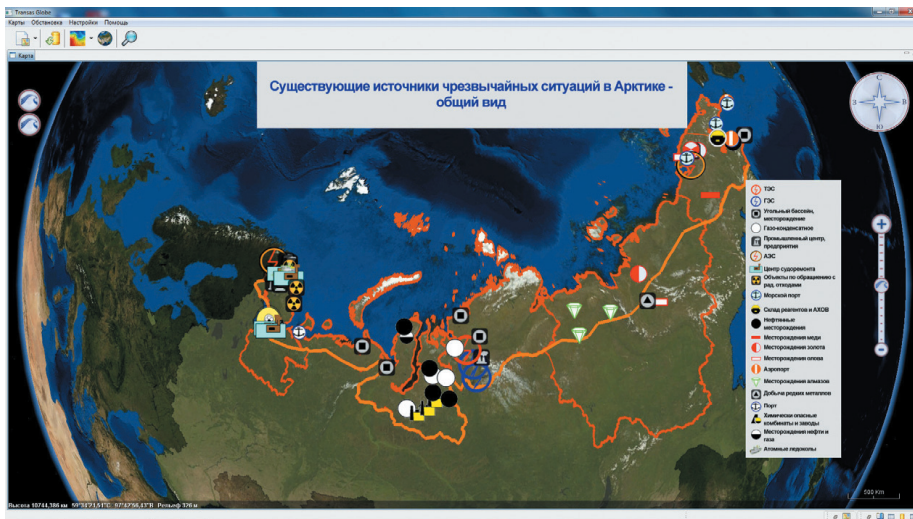
Рис. 1 Существующие промышленные и транспортные объекты